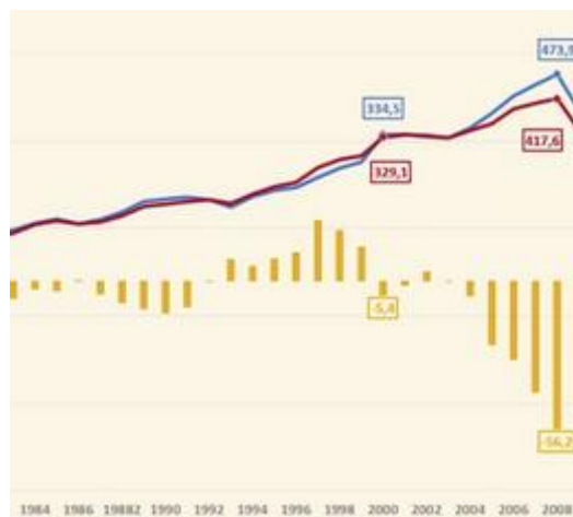
Figure 3: evolution économique

Quis enim aut eum diligat quem metuat, aut eum a quo se metui putet? Coluntur tamen simulatione dumtaxat ad tempus. Quod si forte, ut fit plerumque, ceciderunt, tum intellegitur quam fuerint inopes amicorum. Quod Tarquinius dixisse ferunt, tum exulantem se intellexisse quos fidos amicos habuisset, quos infidos, cum iam neutris gratiam referre posset.